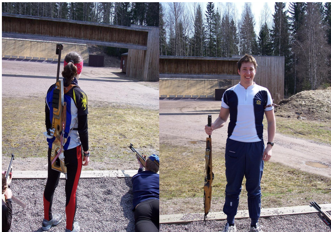
Jediné dva způsoby nošení zbraně na střelnici

4) Nevystřelí-li závodník 10x při každé střelbě, bude diskvalifikován.